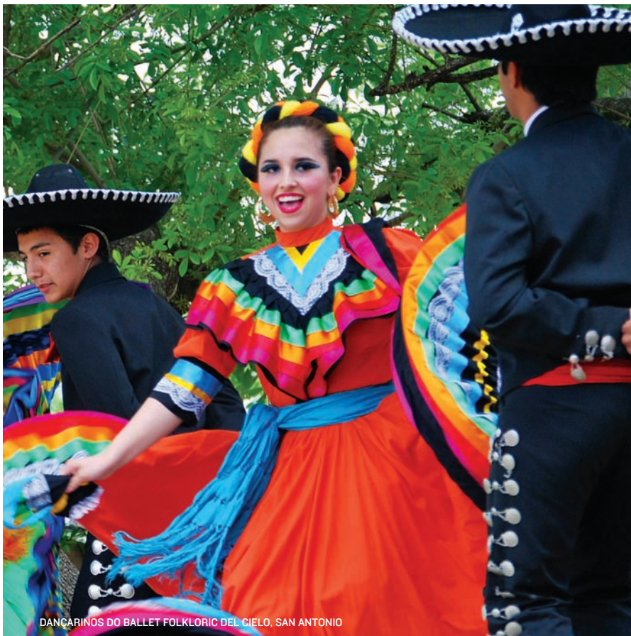
DANÇARINOS DO BALLET FOLKLORIC DEL CIELO, SAN ANTONIO

Uma variedade de plantas de cada região do estado está representada neste complexo espetacular de 14 hectares. Além do jardim formal, os destaques são uma coleção de ervas, um jardim