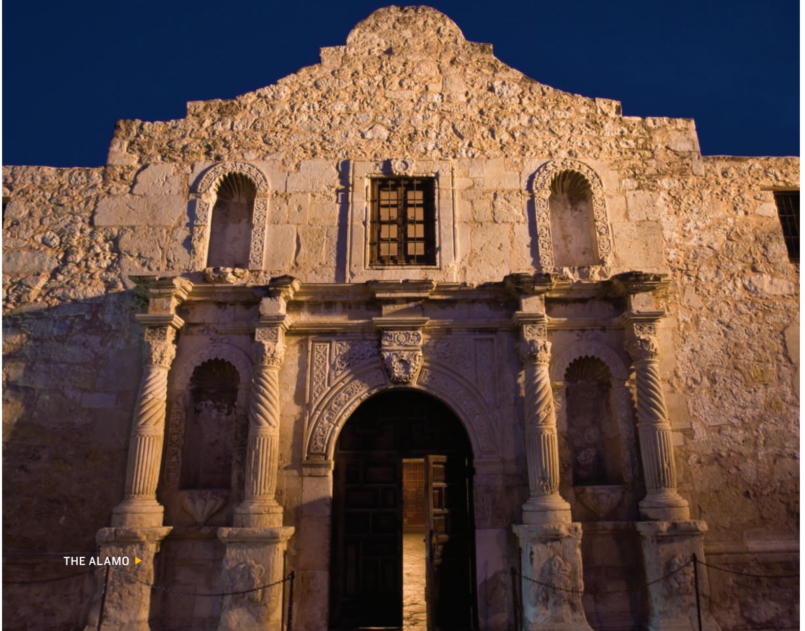
THE ALAMO ▶

O PORTAL DAS PLANÍCIES DO SUL DO TEXAS, SAN ANTONIO INCORPORA O melhor da região. O colorido Rio Walk atravessa o centro, onde as antigas missões, igrejas e monumentos suplementam o ambiente histórico do Tex-Mex. Um pouco mais ao sul, cidades como McAllen, Hidalgo e Laredo acentuam a atmosfera multicultural das planícies. O Edinburg Scenic Wetlands, onde os pássaros e borboletas podem ser vistos em seu habitat natural, é um exemplo de como esta região é um paraíso para os animais.