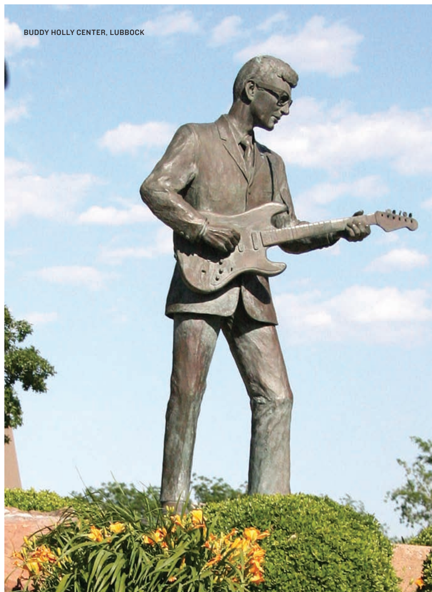
BUDDY HOLLY CENTER, LUBBOCK

Um paraíso de tema tropical para toda a família, este parque aquático tem escorregadores aquáticos com torres de 12,1 a 15,2 metros, parque infantil Kiddie Park, o rio "Lazy River" e o Tidal Wave Pool, piscina com ondas gigantes. Para se secar, assista a um concerto ou jogue vôlei de areia. WC