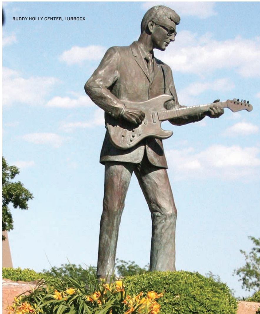
BUDDY HOLLY CENTER, LUBBOCK

1000 E. Central Fwy. Wichita Falls, TX 76301 940-322-5500, castawaycovewaterpark.com